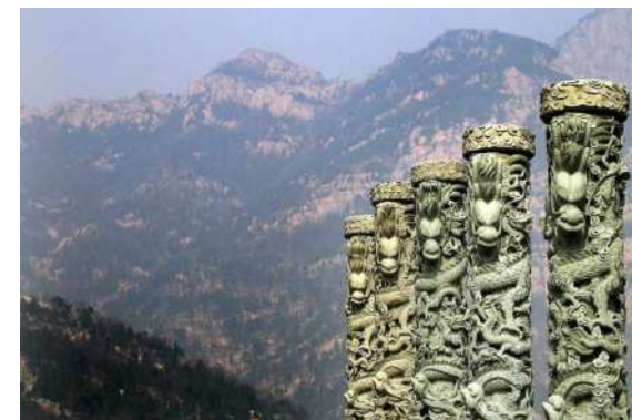
Berg Tai Shan