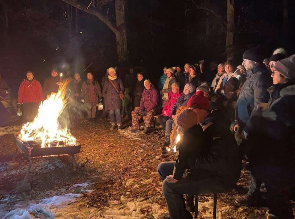
Waldweihnacht in Tittling